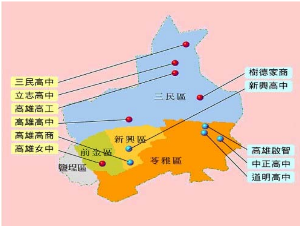
圖 1 95 年度高雄市中區建構適性學習社區高中職學校分佈

本適性學習社區位於高雄市中區，合作社區範圍東鄰澄清路，西至七賢二路，南起二聖路，北到鼎山路，涵蓋面積約 31 平方公里。在合作範圍內的各行政區中，面積大小比例以三民區差異較大，其實際面積請參考表 1 所示。由表中亦可得知，此區學生若跨區就學，可能會浪費更多往返之交通時間。